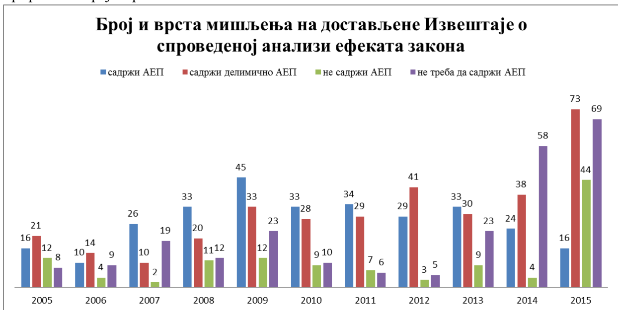
Графикон 1. Број и врста мишљења

Предуслов за спровођење квалитетног процеса анализе ефеката прописа је детаљна анализа постојећег стања. Органи државне управе врше праћења стања у области као један од основних послова државне управе. У пракси се утврђивање постојећег стања врши селективно, а чак и када се стање у области ажурно прати, прикупљени подаци о стању се ретко систематски прикупљају, обрађују, анализирају и објављују. У том смислу, при спровођењу анализе ефеката прописа у дефиницији проблема који се желе решити, па самим тим и у дефинисању циљева доношења закона, у одређеним случајевима изражена је арбитрарност министарстава у погледу дефинисања разлога за доношење конкретног закона. Додатни проблем је што у недостатку података о стању у областима, у спровођењу ех ante анализе је тешко извршити компаративну анализу трошкова и користи који се односе на привреду и грађане. У правном и институционалном систему Републике Србије не постоји континуирана контрола спровођења обавезне ех post анализе јавних политика и прописа којима се ове политике спроводе, те чак и када министарство води сврсисходно праћење стања у области, подаци нису увек доступни државним службеницима који спроводе анализу ефеката конкретног нацрта закона. Обавеза израде ех post анализа и њена доступност свим званичним предлагачима прописа и докумената јавних политика би допринела квалитетнијом разрадом опција за решавање проблема и значајно би унапредила процес израде и праћења прописа и других јавних политика.