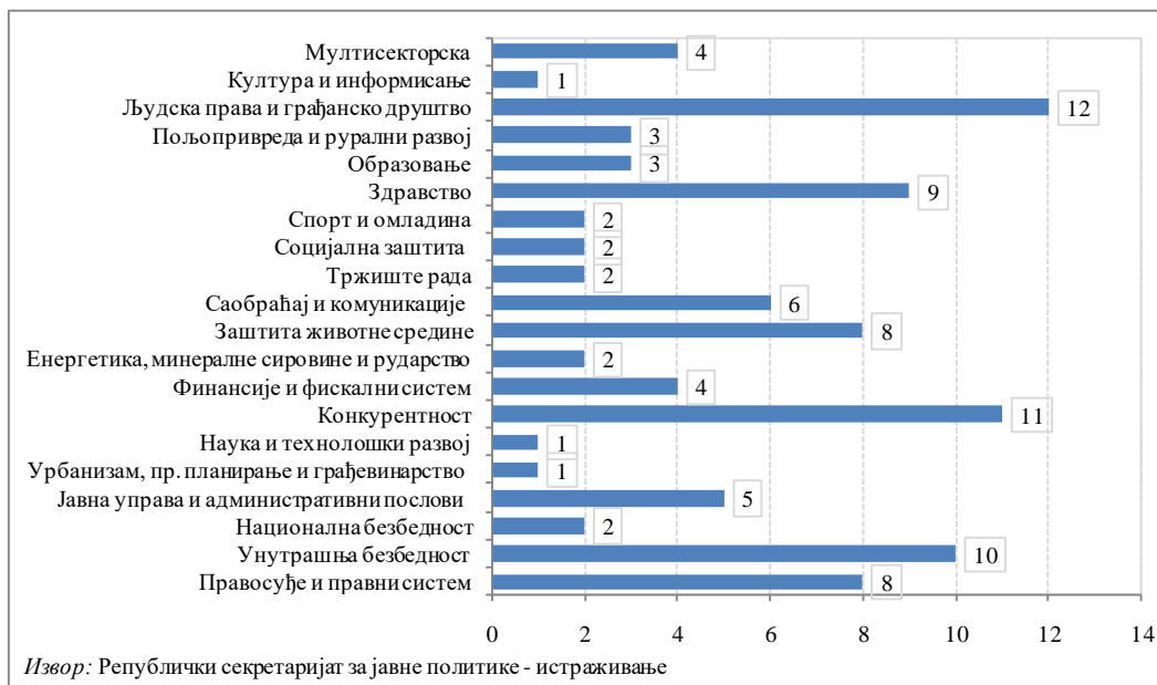
Графикон 3: Број стратегија са важећим роком по областима

Приступање ЕУ је један од основних стратешких циљева Републике Србије. У том смислу, Република Србија је усвојила Национални програм за усвајање правних тековина Европске уније 2014-2018 (НПАА), и он представља свеобухватни плански докуменат који садржи активности које ће предузимати органи државне управе у циљу усклађивања домаћег законодавства са законодавством ЕУ. Изузетно је битно да се плански документи Републике Србије доносе у складу са испланираном динамиком у НПАА, али и у другим планским документима Владе, као што су Акциони план за спровођење Програма Владе, План рада Владе за одређену годину, односно да буду међусобно потпуно усклађени, као и да постоји адекватан контролни механизам којим би се обезбедила усклађеност докумената јавних политика са већ усвојеним планским документима.